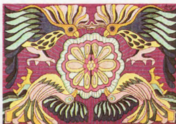
Four Blue Birds and Flower