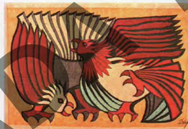
Orange Fighting Cocks