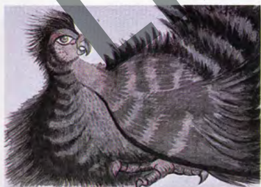
Bird of Guatemala