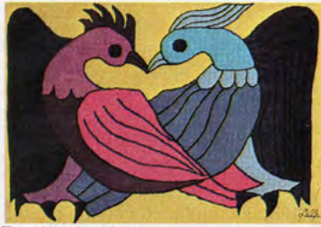
Two Kissing Doves