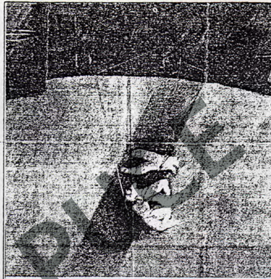
Personajes y paisajes imaginarios en la pintura de Elda Di Malio.

Todo el proceso es en técnica mixta. La textura es hecha en acrílico, la parte cromática es el resultado de varias capas, de donde trato que el color salga desde el fondo...en la textura es donde raspo, grafico, araña, hago de todo.