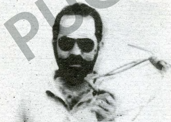
HOJA DE VIDA