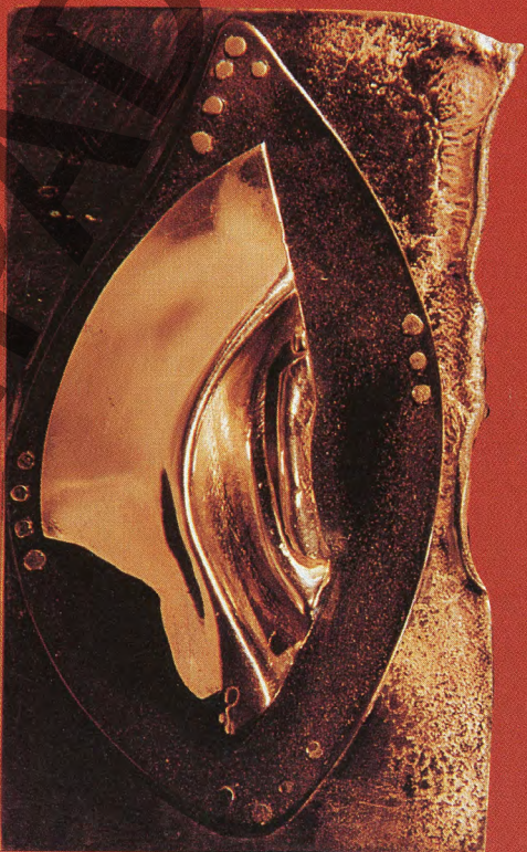
C L A U D I O M A L D O N A D O