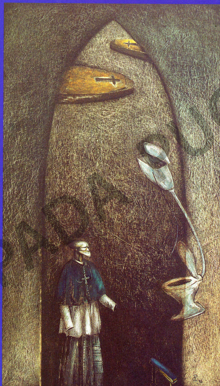
QUE SE HAGA LA VOLUNTAD DE DIOS ¡VAYA PUES, QUE ES LO QUE SOMOS, EN RESUMIDAS CUENTAS! Pintura, acrílico sobre cartón. Painting, acrylic on cardboard. 69 cm x 40 cm.