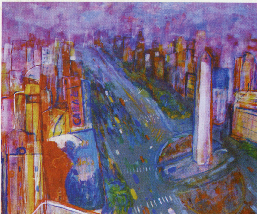
Obelisco / 2000 130x110